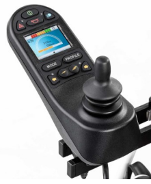
Χειριστήριο R-NET με έγχρωμη οθόνη LCD