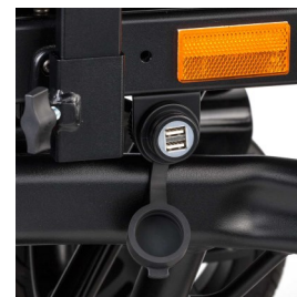
2πλος φορτιστής USB