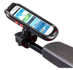
Βάση για κινητό τηλέφωνο