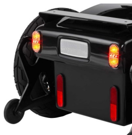
Φώτα LED εμπρός και πίσω