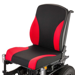
Εργονομικό κάθισμα «ErgoSeat»