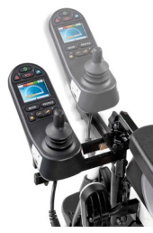
Περιστρεφόμενη βάση χειριστηρίου ρυθμιζόμενη κατά μήκος και ύψος