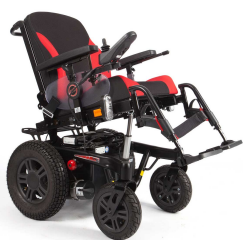
Ηλεκτρικά ρυθμιζόμενη γωνία καθίσματος από -2° έως +26°

Χρώμα ταπετσαρίας καθίσματος: Μαύρο-Κόκκινο