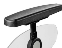
Αποσπώμενο και ρυθμιζόμενο πλαϊνό με μαλακό υποβραχιόνιο.