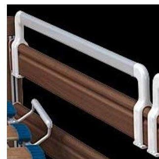
ΠΛΑΪΝΗ ΠΡΟΕΚΤΑΣΗ ΥΨΟΥΣ