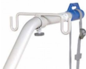
ΒΑΣΗ ΣΤΑΤΟΥ ΔΙΠΛΟ